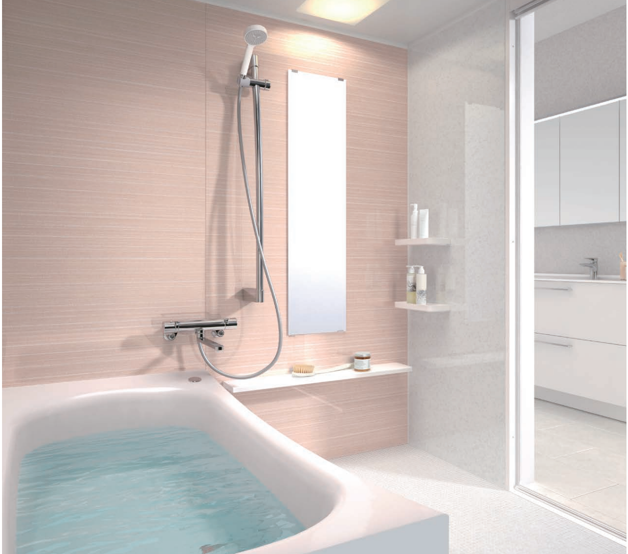
●基本仕様:P.107 ●セレクト:P.108～ ●オプション:P.229～ ●詳細図:P.249 プランNo.WY08A